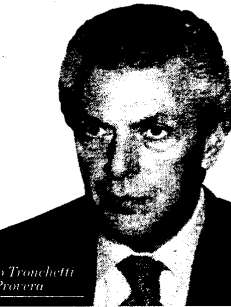
Marco Tronchetti Provera

Valore che è continuamente richiesto dall'azionista di riferimento, che deve recuperare il peso di un'acquisizione a caro prezzo: